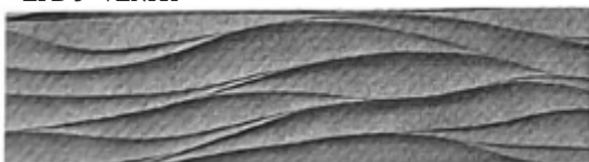
LPD 5 VLNKA